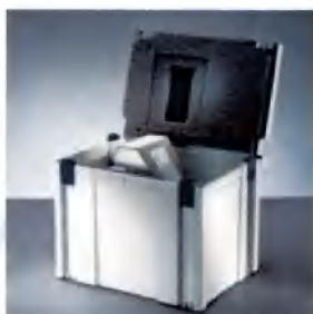
Composeal® Universal Transportkoffer. Optional verfügbar