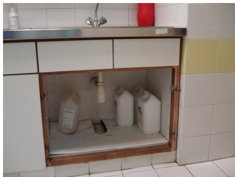
ΧΩΡΟΙ ΜΠΟΧΟΥΜ ΜΕΘ2

Τα χρώματα των μελαμινών θα είναι επιλογής της Υπηρεσίας.