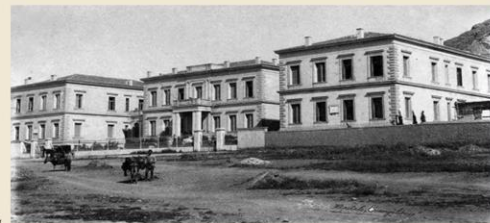
«Ο Ευαγγελισμός» το 1884