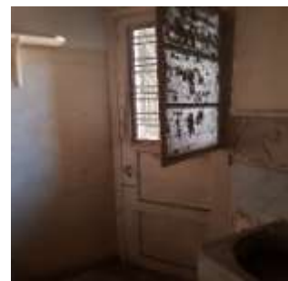
Εικόνα 10- Υφιστάμενη κουζινόπορτα