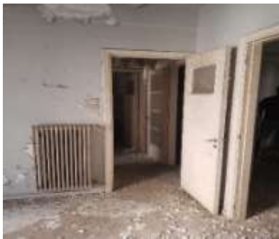
Εικόνα 5- Εικόνα από το εσωτερικό του χώρου