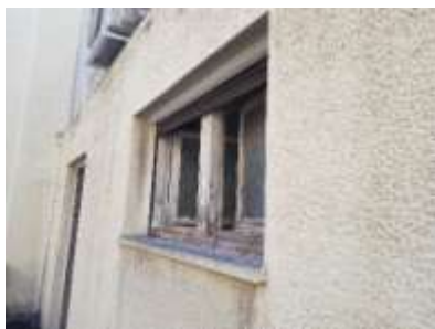
Εικόνα 8- Τυπικό κούφωμα- εξωτερική λήψη