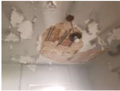
Εικόνα 2- Άποψη από το εσωτερικό του διαμερίσματος