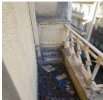
Εικόνα 6- Εικόνα από τον εξώστη του χώρου