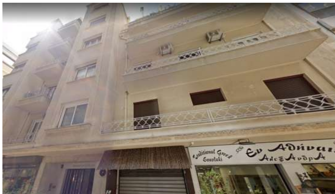
Εικόνα 1- Εξωτερική άποψη του κτιρίου

Εικόνα της εξωτερικής όψης του κτιρίου προσκομίζεται παρακάτω: