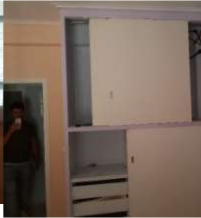
Εικόνα 3- Άποψη υφιστάμενης ντουλάπας