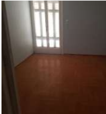
Εικόνα 4- Άποψη υφιστάμενου παρκέ