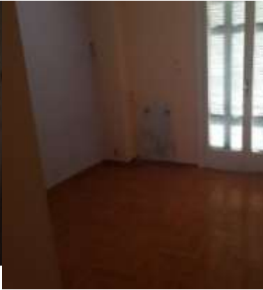
Εικόνα 2- Άποψη κουφώματος